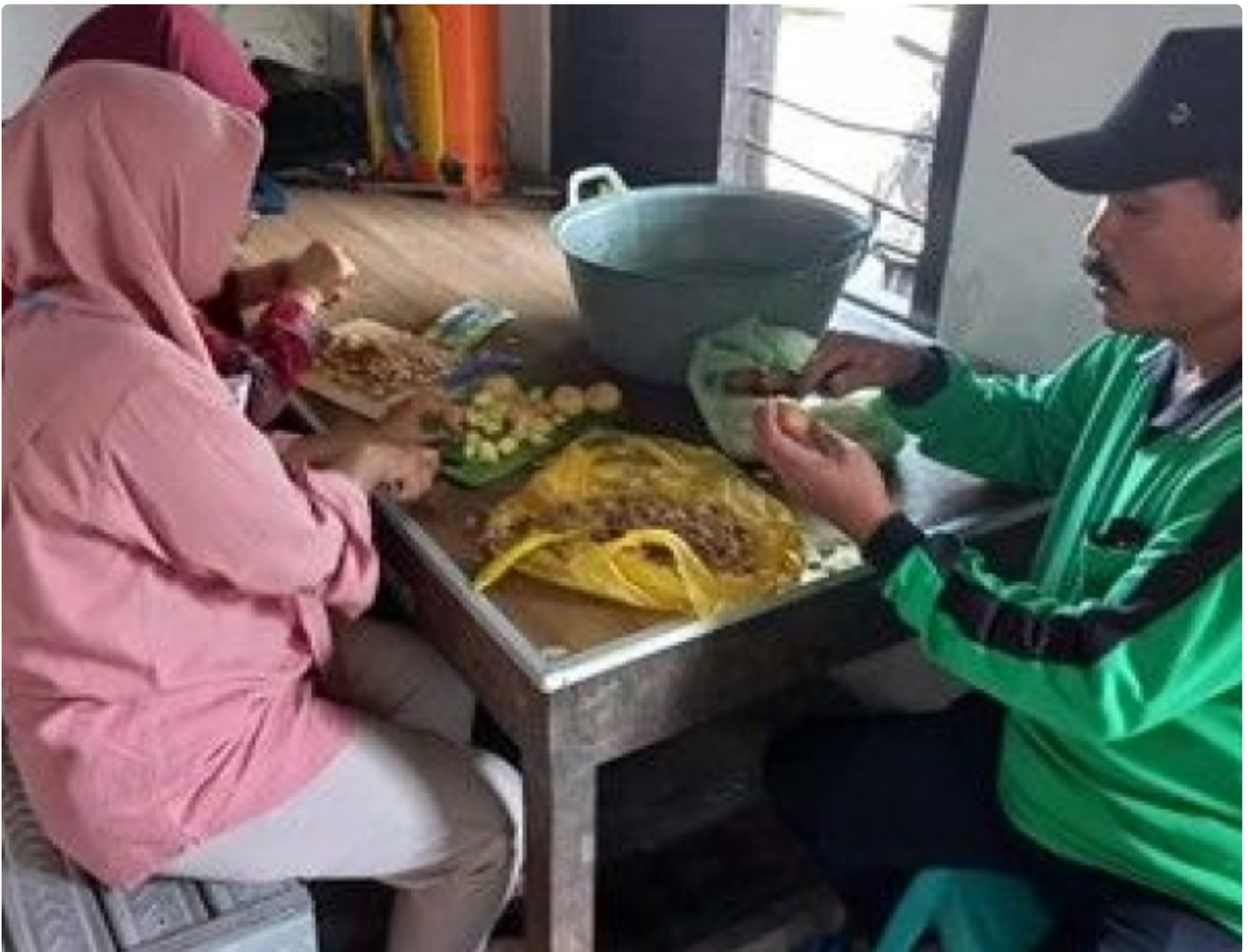
Gapoktan membantu dalam proses pembuatan media perbanyakan

BANYUWANGI - Tim Doktor Mengabdikan (DM) Universitas Brawijaya melakukan pelatihan dan bimbingan teknis pembuatan teknologi agens hayati di Desa Buluagung, Seneporejo, dan Temurejo yang terletak di Kabupaten Banyuwangi. Ketiga lokasi tersebut memiliki potensi besar sebagai desa wisata penghasil buah naga, Selasa (13/9/2022).