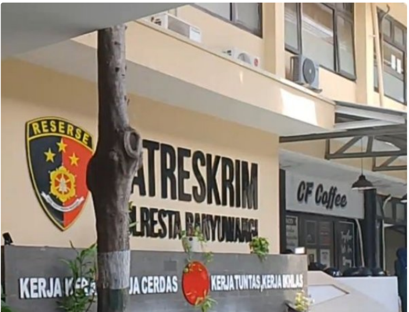
Kantor Satreskrim Polresta Banyuwangi

Banyuwangi - Oknum ASN Guru SMAN 1 Bangorejo berinisial NF akhirnya resmi di laporkan ke Mapolresta Banyuwangi oleh Syam Halim, wartawan disalahsatu media online Nasional. Senin (29/7/2024)